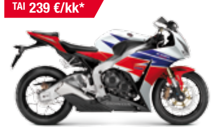
CBR1000RR Fireblade '2013

Saatavana myös e-ABS-jarrujärjestelmällä varustettuna sh. 18 990 €