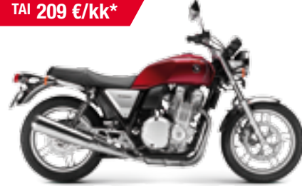
CB1100 ABS '2013