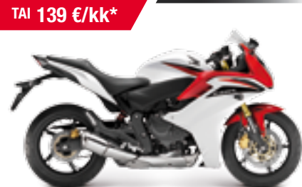
CBR600F ABS '2011