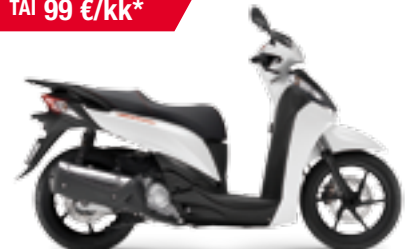
SH300 ABS '2013