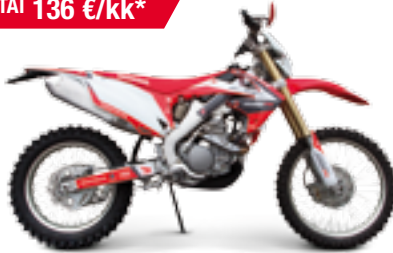
CRF250R Enduro '2013