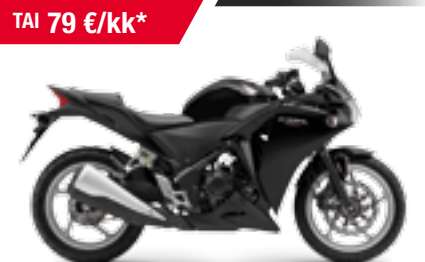
CBR250R ABS '2012