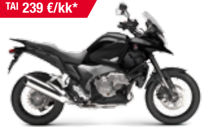
VFR1200X Crosstourer '2012

Kaupan päälle RTG-paketti! EDUN ARVO 3 156 €