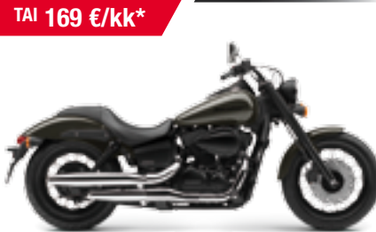
VT750C2 Black Spirit