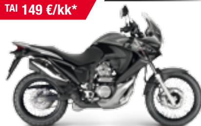
XL700V ABS Transalp '2012