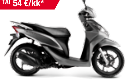
NSC50 Vision '16