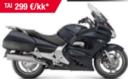
ST1300 ABS Pan European