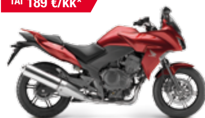
CBF1000F ABS '2013 Alakatesarja ja laukkupaketti 990 €! EDUN ARVO 1 600 €