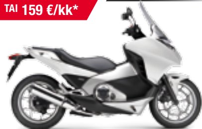
NC700D ABS DCT Integra '2013