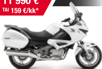
NT700V ABS Deauville '2012