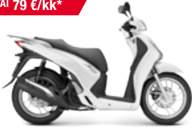
SH125 ABS '2013