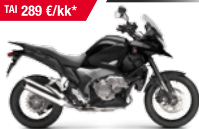
VFR1200X DCT Crosstourer '2013 Kaupan päälle RTG-paketti! EDUN ARVO 3 156 €