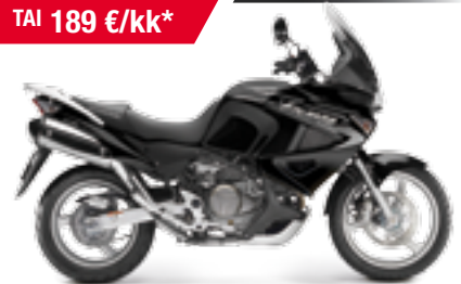
XL1000V ABS Varadero '2012