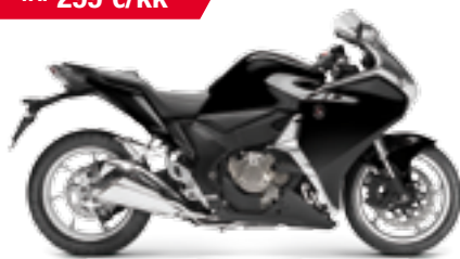
VFR1200F ABS '2013 Saatavana myös DCT-kaksoiskytkin- vaihteistolla sh. 23 990 €