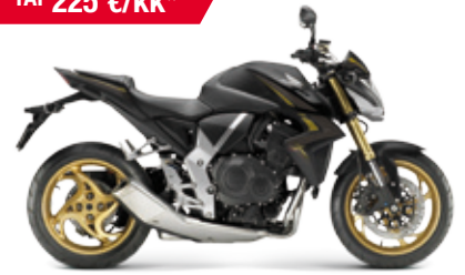
CB1000R ABS '2014