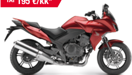
CBF1000F ABS '2013