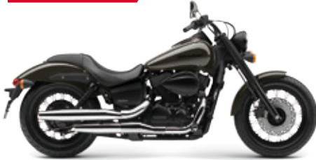
VT750C2 Black Spirit '2014