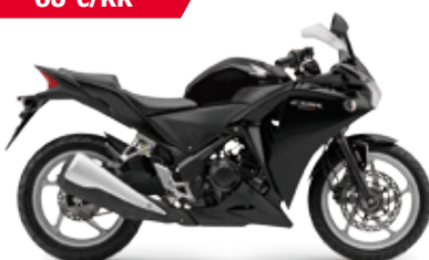
CBR250R ABS '2012