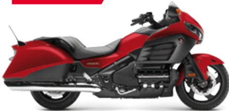
GL1800 F6B '2014