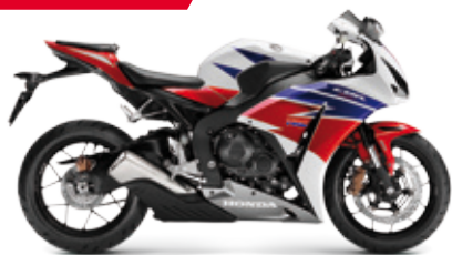
CBR1000RR Fireblade '2014

Saatavana myös e-ABS-jarrujärjestelmällä varustettuna sh. 18 790 €