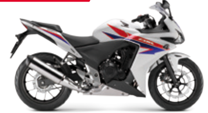
CBR500R ABS '2014