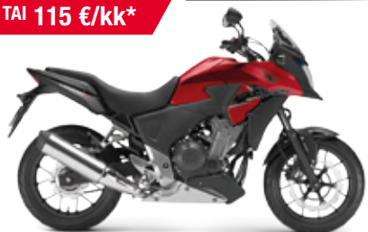
CB500X ABS '2014