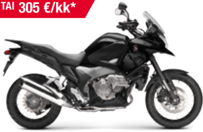
VFR1200X DCT Crosstourer '2013 Kaupan päälle RTG-paketti! EDUN ARVO 3 156 €