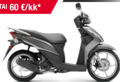
NSC50 Vision '16 '2014