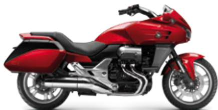
CTX1300 ABS '2014