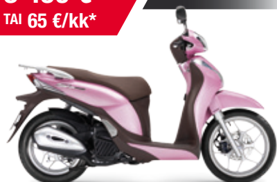
SH125 Mode '2014