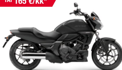
CTX700N ABS DCT '2014