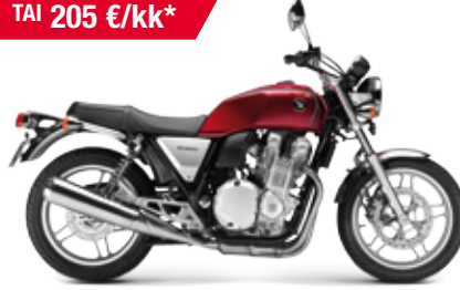
CB1100 ABS '2013