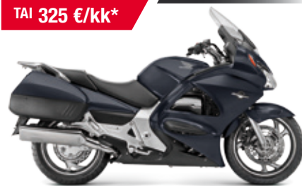
ST1300 ABS Pan European